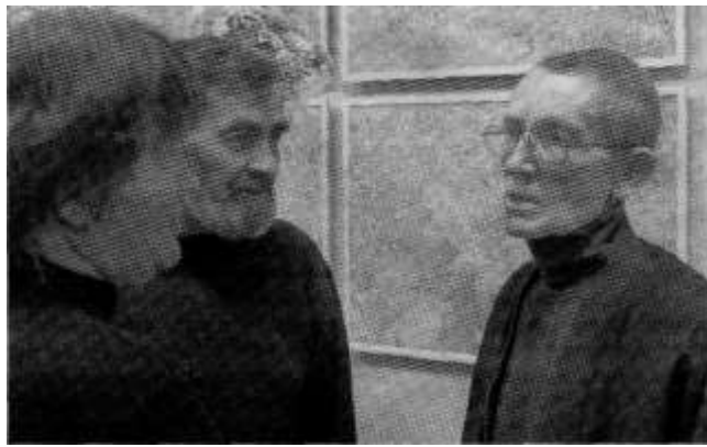
Художник и поклонники